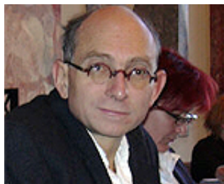
Sepp Brugger verurteilte Regierungshaltung