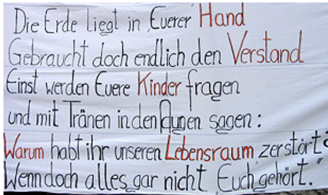
Transparent-Wortlaut bei Demo gegen Tiwag-Kraftwerk in Raneburg

Aufregung nach der Landtagssitzung zum Thema ?Wasserkraft? in Osttirol: Bürger und Initiativen fühlen sich von Landeshauptmann brüskiert.